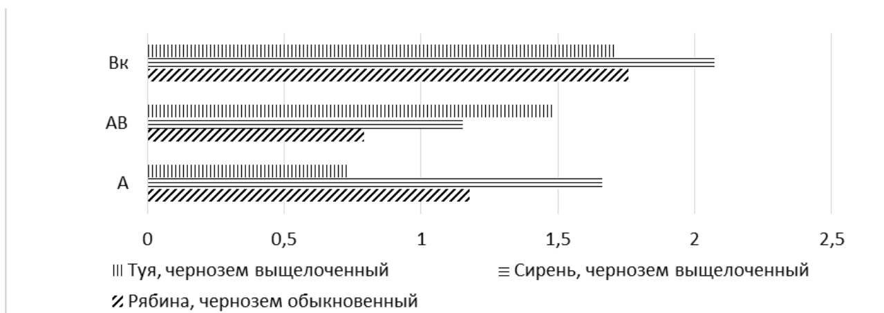
Рис. 1. Объемная теплоемкость черноземов под насаждениями декоративных культур при нулевой влажности

Примечание. Относительные погрешности измерений: E_{C_p} = 3,1\% ; \alpha = 2,3\% ; \lambda = 3,9\% .