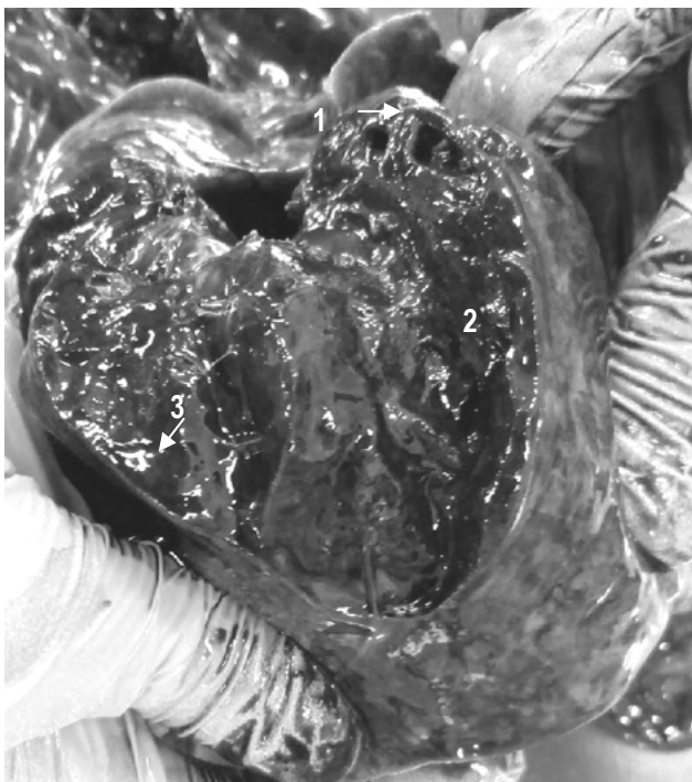
Рис. 3. Собака, сука, возраст 7 мес., беспородная. Острая катарально-гнойная бронхопневмония (левая краниальная доля). Бронхи: 1 – в просвете содержат бело-желтую жидкость сметанообразной консистенции; легкие: 2 – темно-красные цвета, легочная плевра напряжена, гладкая блестящая, паренхима тестоватой консистенции. С поверхности разреза стекает бело-желтоватой сметанообразной консистенции жидкость (3)

Лимфатические узлы (bronхиальные, средостенные) увеличены, овально-округлой формы, упругой консистенции, на разрезе сочные, серо-красноватого цвета, граница между корковым и мозговым веществом нечеткая (острый серозно-геморрагический лимфаденит бронхиальных и средостенных лимфатических узлов).