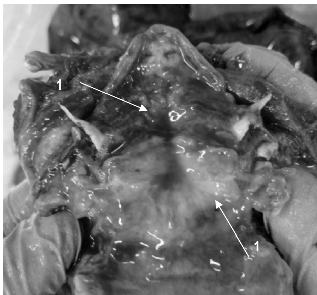
Рис. 1. Собака, сука, возраст 7 мес., беспородная. Острый геморрагический ларингит: 1 – хрящи гортани: слизистая оболочка влажная, блестящая, красного цвета, набухшая

Трахея: содержится пенная красновато-желтоватая жидкость; хрящи гортани и хрящевые кольца трахеи эластичные; слизистая оболочка влажная, блестящая красного цвета, набухшая (рис. 2).