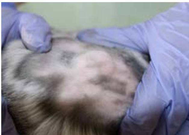
Рис 4. Внешний вид зоны внедрения имплантата из бактериальной целлюлозы через 6 мес. после операции