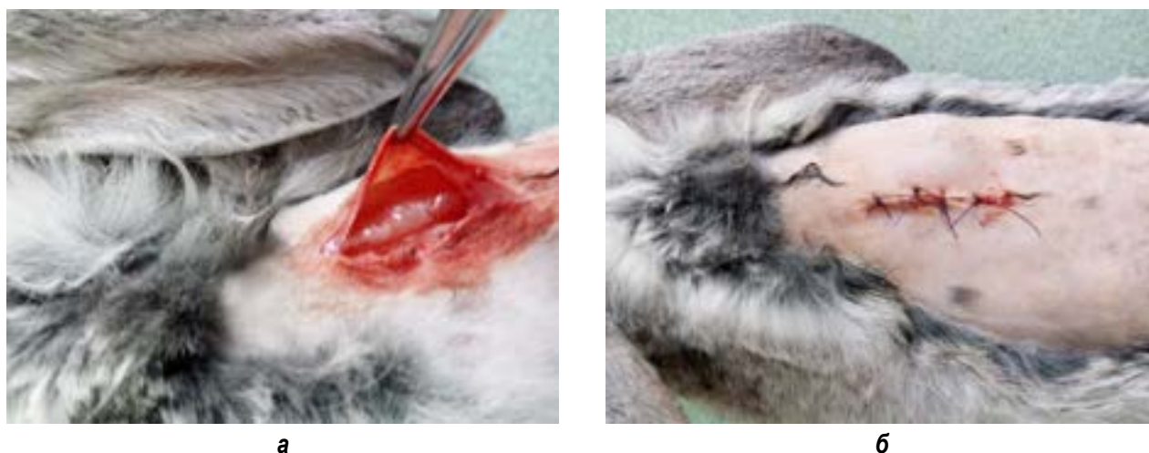
Рис. 3. Ход операции по внедрению имплантата из бактериальной целлюлозы: а – размещение имплантата в широкую мышцу спины; б – внешний вид раны после операции

На всём этапе эксперимента у животных (n=10) в области внедрения имплантата не регистрировали клинических признаков воспаления. У кроликов операционные раны заживали по первичному натяжению. Патоморфологических различий в реакции окружающих имплантат тканей не установлено, это свидетельствует о его биологической совместимости с тканями животных. На 7-е сутки наблюдали незначительную воспалительную реакцию мышц спины, что связываем главным образом с ответной реакцией организма на операционную травму. Через 6 мес. вокруг имплантата определялась фиброзная капсула, без признаков воспаления в окружающих тканях (рис. 4).