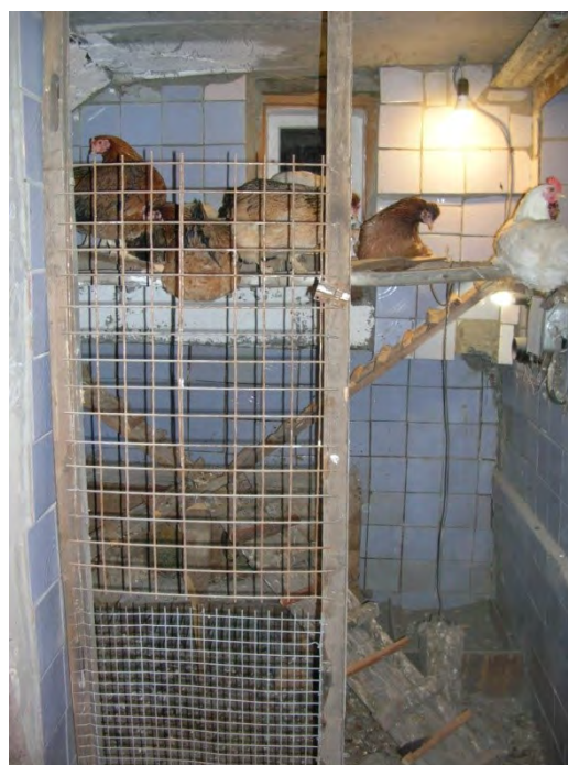
Рис. 3. Пример размещения элементов оборудования для кур-несушек

5. Модуль помещения и оборудование для кур-наседок. Для наседок подходит любое гнездо, но необходимо подумать о цыплятах в период их вывода. Если наседка находится под постоянным наблюдением и мы отнимаем цыплят по мере их вывода, то наседка выведет цыплят и в обычном гнезде. Но такой подход нерационален. Наседка сама вполне справится со всеми проблемами. При конструкции гнезда учитываются особенности поведения цыплят и наседки в период вывода.